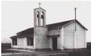
LA CHIESETTA DEL VILLAGGIO

I l Villaggio san Marco, allestito nel 1953 all'interno dell'ex Campo di Fossoli, ospitò 250 famiglie italiane provenienti da Istria e Dalmazia: alcune di queste vi rimasero per 17 anni. Le testimonianze, i ricordi, le analisi storiche di questa vicenda sono state raccolte ora in un volume, a seguito del convegno nazionale di studi che si svolse a Carpi nel 2013.