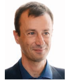
Cesare Galantini, Assessore alla Mobilità sostenibile

I biglietti singoli si acquistano a bordo grazie all'emettitrice automatica, ai parcometri (il biglietto vale per il solo giorno di rilascio e il tempo di viaggio decorre dal momento dell'emissione) o presso le rivendite autorizzate e la biglietteria di Seta spa. ■